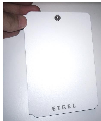
Slika 7: Vratca z vijakom

V vzdrževalnem prostoru, za servisnimi vratci, se nahaja nalepka s tehničnimi informacijami, ki vključuje vse osnovne informacije polnilne postaje, modelski tip in serijsko številko. Če potrebujete podporno službo, je potrebno poznati modelski tip, da lahko podpora služba hitro priskoči na pomoč.