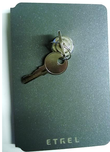
Slika 6: Vratca s ključavnico