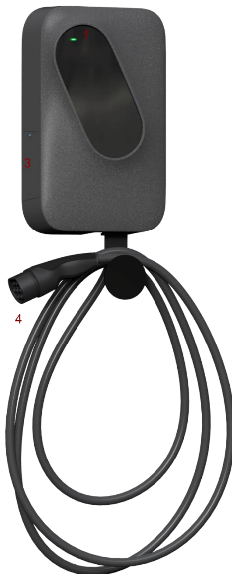
Slika 2: Etrel INCH LITE z vtičnico