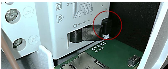
Slika 5: Gumb za testiranje FID stikala (RCD)

Regulativa zahteva, da je zaščitno stikalo na uahjavi tok, FID stikalo (RCD) redno testirano in potrebno je voditi tudi dnevnik pregledov. Gumb za testiranje na FID stikalu omogoča preverjanje pravilnega delovanja s simuliranjem okvare, tako da spusti majhen tok skozi FID. To povzroči neravnotežje v zaznavalni tuljavi FID. Če ta zaščitni element ne izklopi ob pritisku na tipko test, je v okvari in mora biti zamenjan s strani pooblaščenega električarja. FID je potrebno zamenjati tudi, če je deloval in se ga ne more vzpostaviti v prvotno stanje. Testiranje FID stikala mora biti opravljeno vsake tri mesece in dokumentirano.