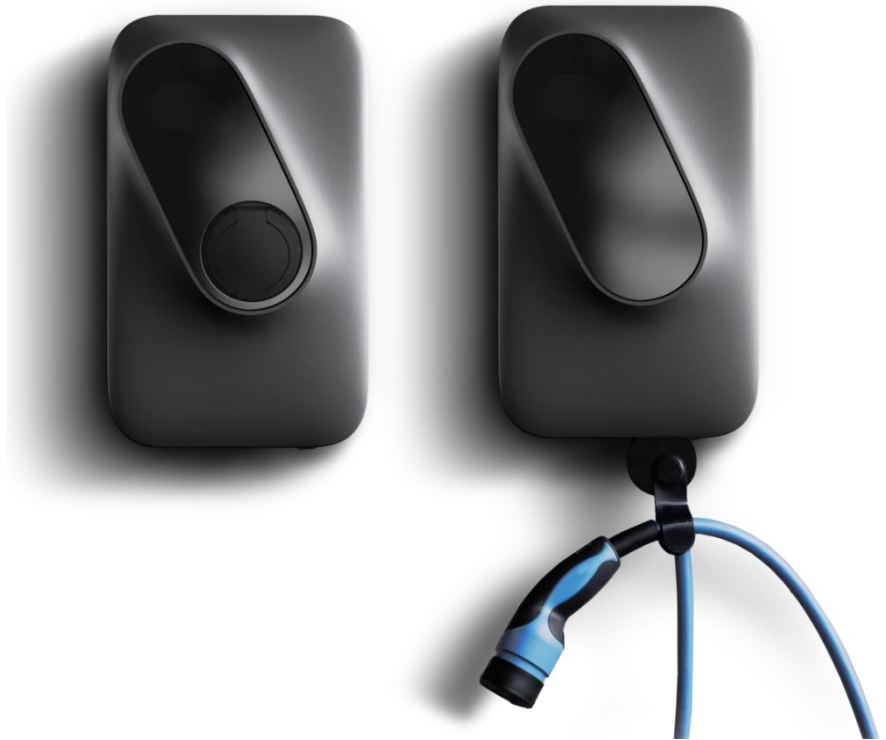
Slika 1: Polnilna postaja Etrel INCH LITE (z vtičnico, s kablom)

Polnilna postaja Etrel INCH LITE je načrtovana in testirana v skladu z najnovejšimi in s starimi mednarodnimi standardi. Polnilna postaja je skladna z zahtevami IEC 61851 (del 1 in del 21-2, Part 22), ki definirajo konduktivno AC polnjenje in podpira polnjenje po načinu "Mode 3" za varno polnjenje standardnih električnih vozil.