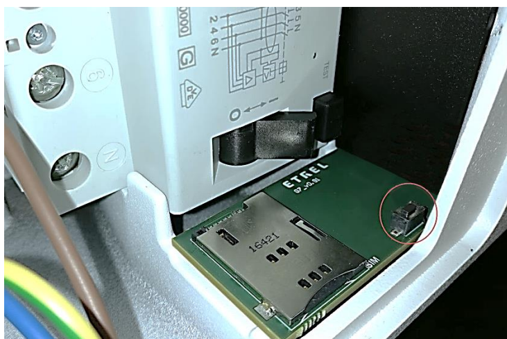
Slika 8: Gumb za ponovni zagon znotraj vzdrževalnega prostora

Po držanju gumba za 4 s, se bo postaja odzvala z zvočnim signalom, po katerem bodo na zaslonu na voljo možnosti za preverjanje IP naslova postaje ali za ponovni zagon postaje. Lahko se zažene ponovni zagon postaje, ali pa tovarniški ponovni zagon, ki obnovi tovarniške nastavitve proizvajalca (uporabniško ime, geslo, privzeti IP naslov in ostale nastavitve).